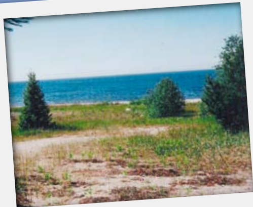
Hiekkadyyni ja ääretön Laatokka Lonkoinlahdella.