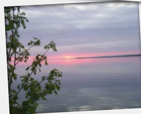
Näkymä laiturilta Uuksalonpähän.