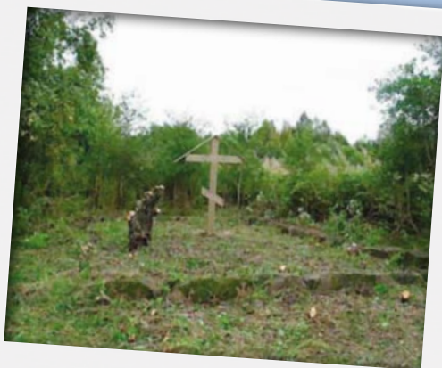
Oritselän tsasounan risti.