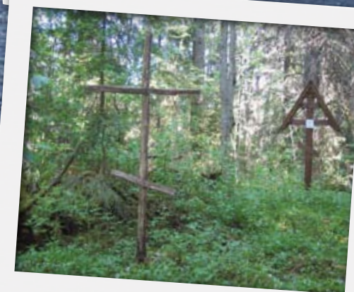
Työmpäisten tsasounan ristit.