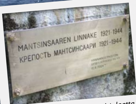
Härkämäen tykkipatterin muistolaatta.